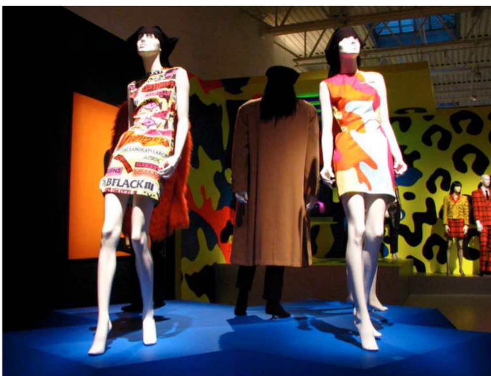
Fig.5 Obras de Stephen Sprouse.

Nesta sequência, a moda e a arte potenciam a forma como os artistas participam em desfiles de catálogos, criadores de moda e manifestações de arte contemporânea. A relação entre as duas áreas é considerada um acontecimento internacional, cada uma no seu papel – “a moda e a arte conquista o estatuto de uma dinâmica efêmera”. “As instalações, cada vez mais presentes nas bienais, confirmam essa propensão”, propensão (Remaury, 1997 citado por Cidreira, 2005) [4]. Muitas das coleções na área do design de moda usufruem da arte como inspiração, com bons resultados na diferenciação e a valorização do produto. Stephen Sprouse, designer e artista plástico, inspirado nas obras de Andy Warhol, e de Jean-Michel Basquiat na sua coleção de vestuário no ano de 1988. (ver fig. 5).