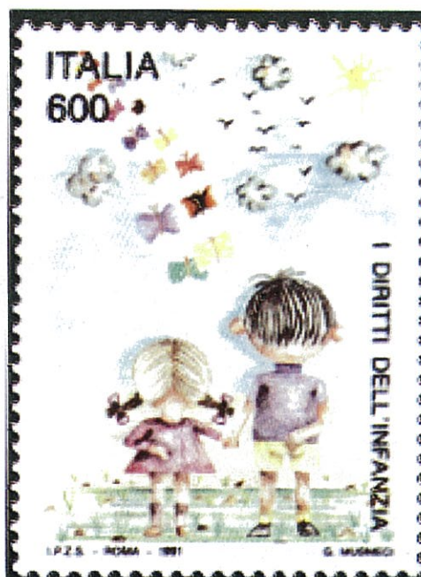
Foto nº4 - Selo Comemorativo dos direitos da criança.