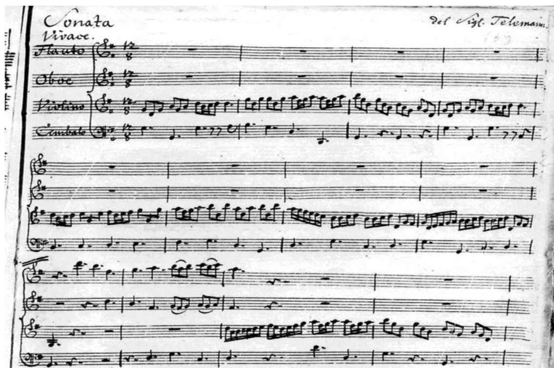
Fig. 2- Manuscrito da Staatsbibliothek de Berlim, TWV 43:G6 34