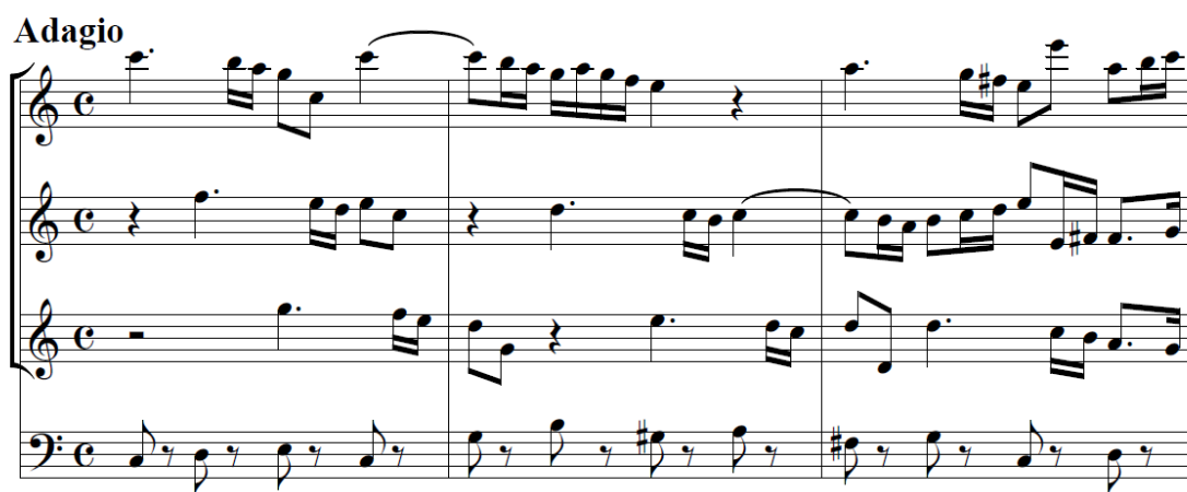
Fig. 39 - Compassos 1 a 3, do Adagio do Concerto em Lá menor , TWV 43:a3.

Enquanto o diálogo se desenrola fervorosamente no início e vai morrendo ao longo do andamento nas vozes obbligato , o baixo mantém-se como voz da razão, perseverante na sua métrica constante e de ritmo descomplicado, em estilo walking bass 54 (fig. 39), que, como Swack (1994) descreve, é também um traço da influência da sonata italiana.