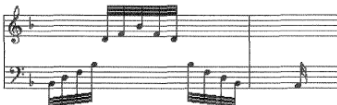
Fig. 55 - Exemplo de resolução de arpejos no acompanhamento do baixo contínuo.

Sobre as cadências, Telemann declara que na cantata devem ser atacadas posteriormente ao término da frase do cantor, por oposição à ópera onde deve ser ao mesmo tempo das últimas sílabas do cantor (Holler, 1995). Este é um exemplo de onde a interpretação difere da notação na partitura.