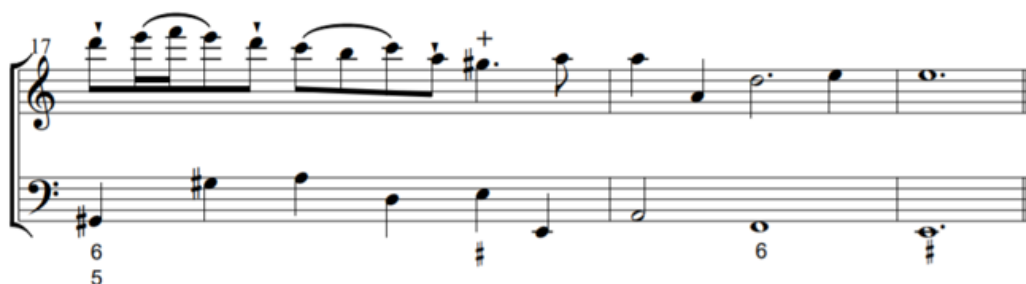
Fig. 9 - Compassos 17 a 19. Final do Grave da Sonata em Dó Maior, TWV 41:C2.

A possibilidade de expressão e oportunidade do músico inferir as suas interpretações e demonstrar o seu engenho é imensa neste andamento (requisito que Quantz menciona). Encontramos mais uma vez entradas na parte fraca do tempo, com pausas que atrasam a melodia, quase como se esta estivesse de facto desfasada ou a fugir da progressão e condução do baixo que a acompanha. A melodia é composta por várias partes, e apenas a final é repetida na sua totalidade como que reiterando um pensamento conclusivo. No entanto, após essa conclusão, com direito a uma cadência perfeita na tónica de lá menor, surge, inesperadamente, uma segunda cadência que nos leva de novo à incerteza (fig. 9).