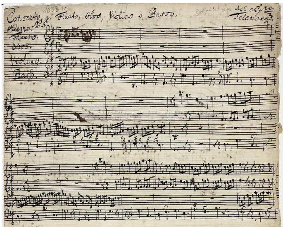
Fig. 1- Manuscrito da Universitäts und Landesbibliothek Darmstadt, TWV 43:G6 33