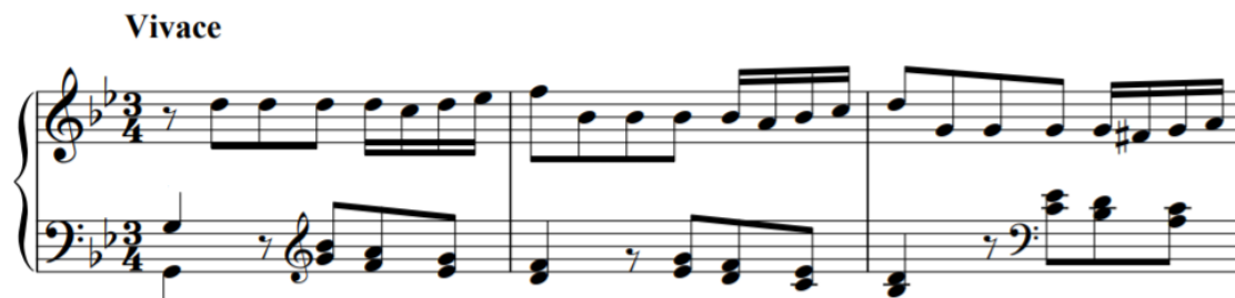
Fig. 40 - Fantasia em Sol menor, TWV 33:8, Vivace , c. 1-3.

Nesta peça verificamos que Telemann faz uso do seu próprio material citando-o, modificando-o, ou simplesmente utilizando os mesmos recursos estilísticos, por exemplo: a primeira frase da oitava fantasia para teclas, TWV 33:8 (fig. 40), aparece no quarto andamento (fig. 41); e entradas em double motto são utilizadas em onze andamentos de trios e quartetos seus (Zohn, 2008).