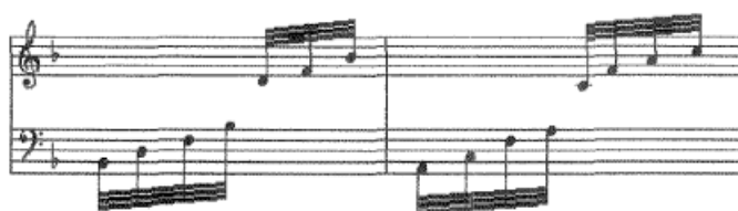
Fig. 54 - Exemplo de resolução de arpejos no acompanhamento do baixo contínuo.