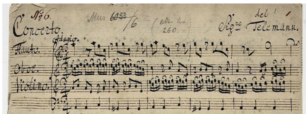
Fig. 36 - Manuscrito do quarteto em lá menor, cópia da Universitäts und Landesbibliothek de Darmstadt 50 .

A classificação desta obra tem sido problemática ao longo da história. No RISM – Répertoire International des Sources Musicales – está categorizada como sonata, onde, como já vimos neste trabalho, se encaixa a mais geral designação de quarteto também utilizada na sua descrição, no entanto a sua análise segundo os vários princípios formais que já apresentámos levanta dúvidas quanto a essa categorização (Paoliello, 2017). A confirmação de um manuscrito original do compositor não é possível visto que nenhuma cópia sobreviveu e as três edições que nos chegam têm por base uma única cópia existente em Darmstadt. Mais recentemente surgiu uma cópia das partes em Haia que vários autores como Klaus Hofmann utilizam para contestar algumas passagens problemáticas transmitidas pelo manuscrito de Darmstadt (Griscom & Lasocki, 2012). O quarteto atualmente aparece então com as designações de “sonata”, “concerto”, e “concerto à 4” (Moran, n.d.).