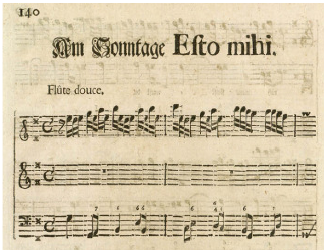
Fig. 53 - Harmonischer Gottesdienst , p. 140, Cantata TWV 1:1258, Seele, lerne dich erkennen, Am Sonnetag Esto mihi 58

Ainda no prefácio da obra, o compositor sugere que a voz pode ser substituída por um instrumento (Holler, 1995):