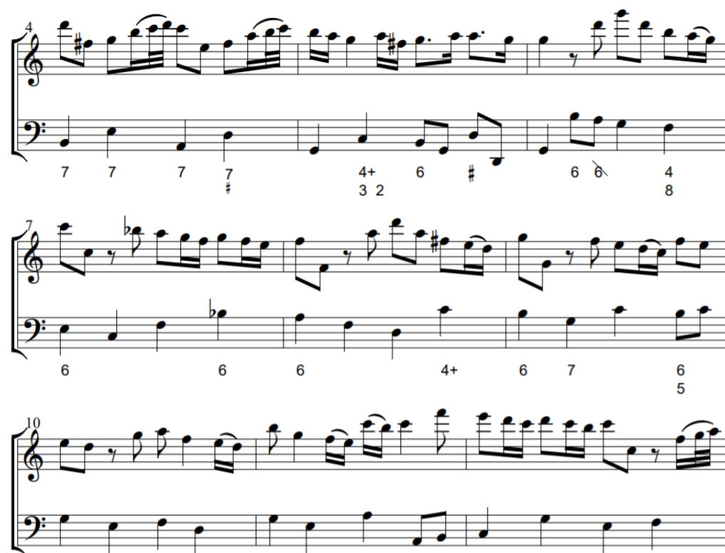
Fig. 4 - Compassos 4 a 12 do Cantabile da Sonata em Dó Maior, TWV 41:C2.

Começando no último tempo do segundo compasso até ao terceiro (e, num grau menor no início de cada tema) podemos encontrar um recurso retórico chamado suspiratio que consiste na utilização de pausas de respiração no início do tempo que quebram a linha melódica de forma a criar a sensação de suspiro, espanto, lamento (Bartel, 1997). Este recurso é utilizado