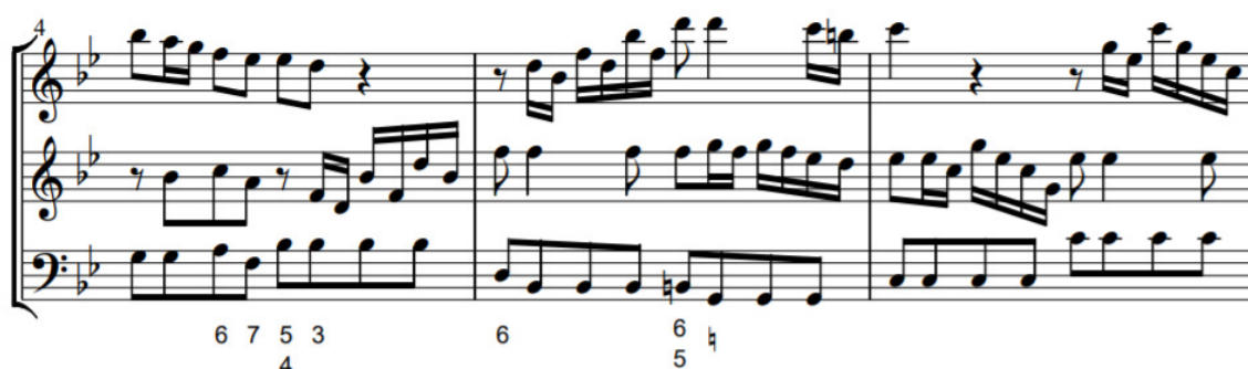
Fig. 24 - Compassos 4 a 6 do Andante da Trio-sonata n°1, TWV 42:c2.

Verificamos que neste andamento existe uma influência do estilo italiano manifestada na condução típica do estilo alla zoppa , com ritmos sincopados que existem em abundância neste andamento e são, também neste caso, criados por várias ligaduras de prolongamento (como observamos logo no primeiro compasso na voz do oboé).