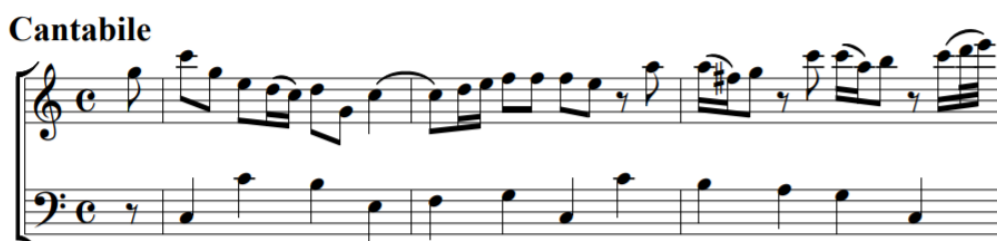
Fig. 3 - Compassos 1 a 3 do Cantabile da Sonata em Dó Maior, TWV 41:C2.

O andamento foca-se num tema principal que é estabelecido e desenvolvido na primeira secção da peça (até à resolução da cadência no c.6), e cujo motto inicial (A, c.1, vide fig. 3) é citado numa segunda secção (A', c. 6-10) com um pequeno desenvolvimento a aparecer mais duas vezes dos compassos 6 ao 7 em sol maior, e do 8 ao 9 em ré maior (fig. 4).