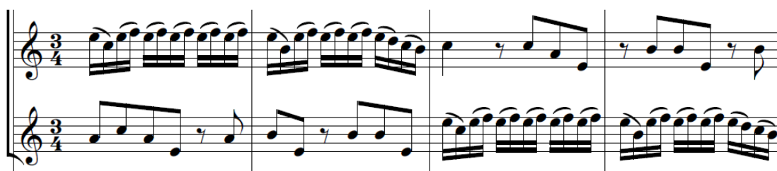
Fig. 37 - Figura de suspiro, compassos 1 a 4, do Adagio do Concerto em Lá menor , TWV 43:a3.

O quarteto 43:a3, um dos mais elaborados e equiparado às obras publicadas pelo compositor da década de 1730, é um “concerto” 51 altamente expressivo do início ao fim. O primeiro andamento apresenta uma incansável sucessão de “figuras de suspiro” 52 , exemplificadas logo pelos primeiros quatro compassos no oboé e no violino (fig. 37), e uma textura onde o material temático composto pela repetição de figuras de semicolcheias acompanhadas por colcheias nas outras vozes é transportado pelas várias vozes dos instrumentos obbligato ao longo do andamento (Harris, 2017; Zohn, 2008).