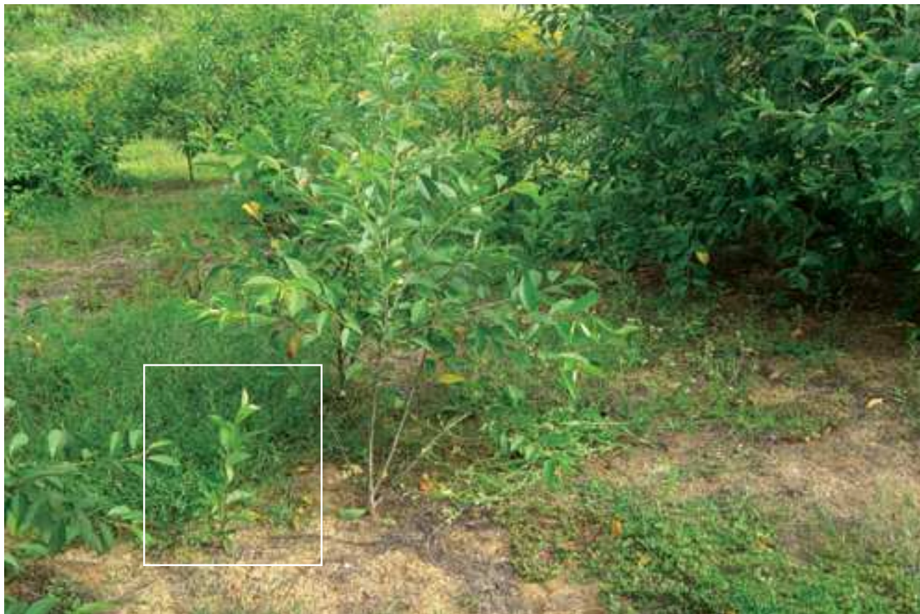
Figura 4 – Aspecto da colonização do espaço por emissão de pólus radiculares.

Ginja de Óbidos e Alcobaça, outro problema, ao nível dos viveiros, diz respeito à escolha do porta-enxerto. Não há em Portugal qualquer estudo, ensaio, colecção ou dados publicados que incluam cultivares de ginjeira em diferentes porta-enxertos. Mesmo os estudos em outros países só incluirão as cultivares com interesse local, não as portuguesas, muito menos uma tão restrita como a que só existe numa região de Portugal e cuja utilização se restringe, quase exclusivamente, à produção de um licor artesanal.