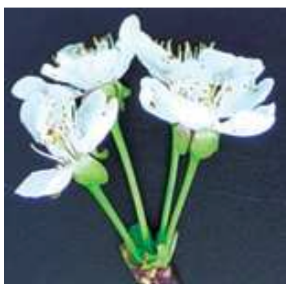
Figura 1 – Diferença morfológica ao nível do característico aspecto da “Folha-no-Pé” (à esquerda) e na “Galega” (à direita), da colecção de Alcongosta, em 2007.