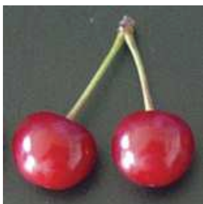
Figura 2 – Diferença no comprimento do pedúnculo da ginja “Folha no Pé” (à esquerda) e da “Galega” (à direita), da colecção de Alcongosta, em 2007.