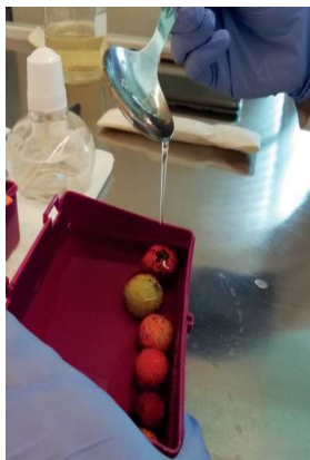
Figura 3. Ensaio de revestimentos bioativos em frutos.