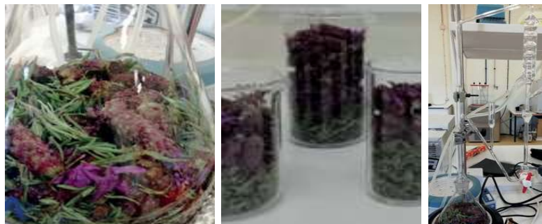
Figura 1. Preparação de material vegetal e hidrodestilação em aparelho Clevenger.

Para a determinação da sua atividade antimicrobiana, os óleos essenciais são testados em ensaios preliminares usando o método de disco - difusão em agar. A concentração mínima inibitória (CMI) é determinada usando o método da microdiluição em caldo para as bactérias e os fungos filamentosos e o método da macrodiluição em caldo para as leveduras. A concentração mínima microbiana (CMM) é igualmente determinada. Na Figura 2 está apresentada uma microplaca usada para a determinação da CMI de óleos essenciais de Origanum vulgare (OO) e Cymbopogon citratus (OEP) sobre Pseudomonas fluorescens ESACB 153, usando o indicador resazurina. Os poços a roxo indicam inibição da multiplicação dos microrganismos e poços a rosa indicam ausência de inibição.