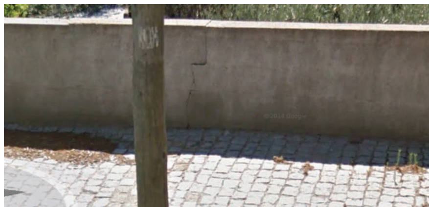
Figura 5 - Fissura central do muro erguido pela Junta de Freguesia, 2014.