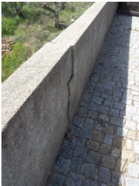
Figura 4 - Fissura central do muro erguido pela Junta de Freguesia, 2016.