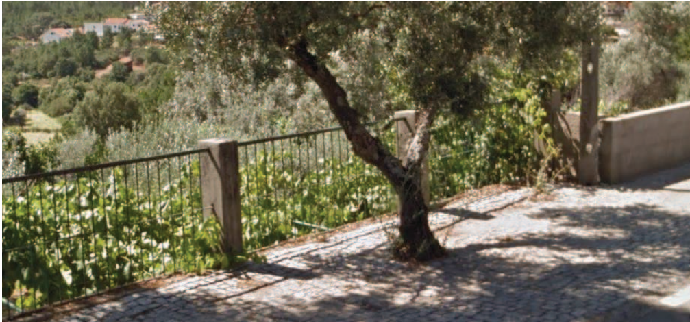
Figura 2 - Estado da calçada em Julho de 2014.