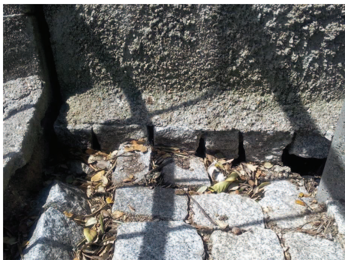
Figura 6 - Instabilidade na fundação do muro de ligação lateral.