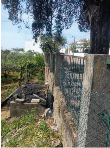
Figura 1 - Desaprumo do muro privado, propriedade de Zulmira Lopes.