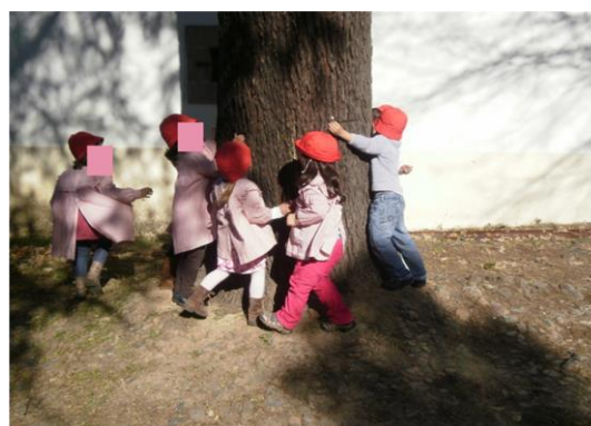
Figuras 7 e 8. À descoberta da quinta

A observação e os registos gráficos forneceram evidências de que as atividades desenvolvidas alargaram e contextualizaram os conhecimentos matemáticos das crianças e estimularam a curiosidade e o desejo de saber mais e compreender fenómenos naturais que ocorrem no seu quotidiano. A evocação e a descrição das