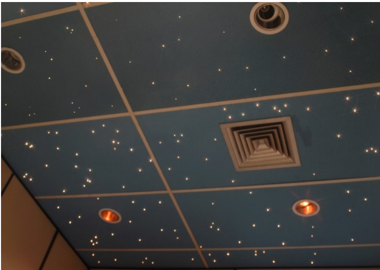
Fig. 8 – Detalhe do teto após a aplicação do efeito céu estrelado com fibra ótica

Foi proposto a aplicação da fibra ótica com efeito do céu estrelado, em pontos de luz suaves e oscilantes, sobre a superfície do forro existente, conjugado com os downlights , mas, neste caso, num desenho assimétricos, e com lâmpadas PAR [2], próximos as paredes para evitar o encadeamento. Foi sugerido, também, um regulador de intensidade de luz, no sentido de criar uma ambiência e destacar o efeito conseguido com a fibra ótica. O teto foi pintado no matiz azul, simulando o céu.