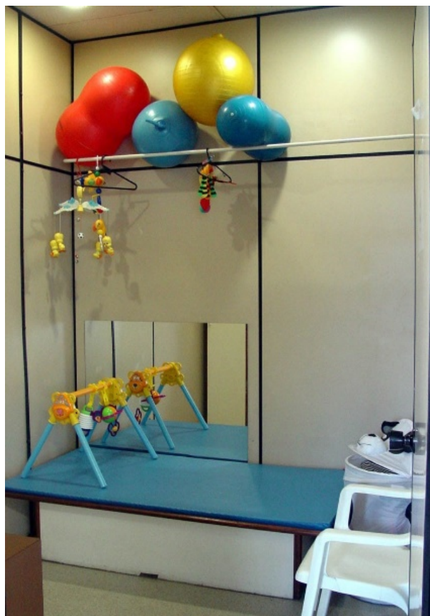
Fig. 6 – Sala de Terapia Ocupacional Visual Infantil da AACD antes da intervenção

Durante a observação comportamental e em entrevistas aplicadas aos terapeutas ocupacionais e familiares, verificou-se que as crianças com paralisia cerebral e que, por consequência sofrem de deficiências visuais e neuro psico-motoras, ofereciam resistência na utilização da sala de TO para fazerem os tratamentos (Degra & Gobi, 2013).