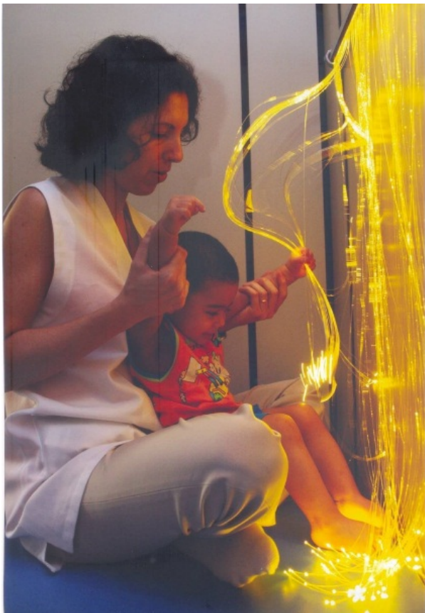
Fig. 10 – Cortina em fibra ótica com troca de cores na sala de Terapia Ocupacional e Visual da AACD

Outro recurso utilizado com a tecnologia da fibra ótica, foi a aplicação de uma cortina de fibra ótica com mudança de cores, que serviu como elemento neuropsicomotor para as crianças. O exercício proposto consistia em que as crianças tocassem na fibra-luz ao atingir determinado cor.