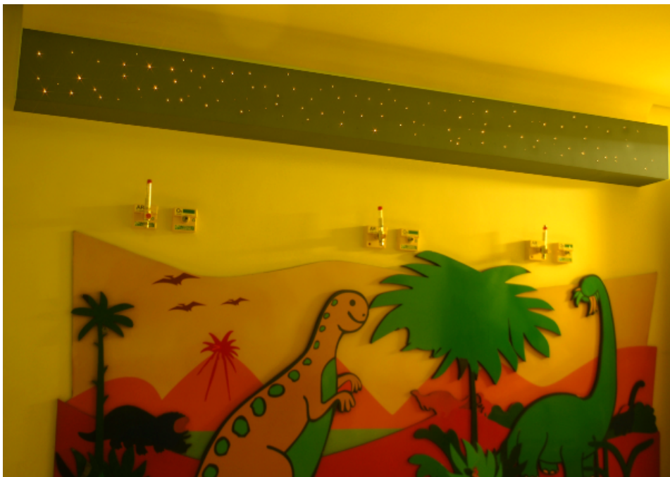
Fig. 5 – Quarto no Hospital do Câncer de Londrina com aplicação de fibra ótica com efeito de céu estrelado

A luz tênue que este efeito cria durante a noite, auxilia o serviço de enfermagem na observação em estado de repouso dos pacientes, bem como na execução dos procedimentos necessários, sem que haja necessidade de acender a iluminação geral, o que ocorria anteriormente. Dessa forma, revelou-se numa ferramenta importante na recuperação dos pacientes através da promoção de um sono reparador e tranquilo e sem sofrer interrupções (Tano, s.d.).