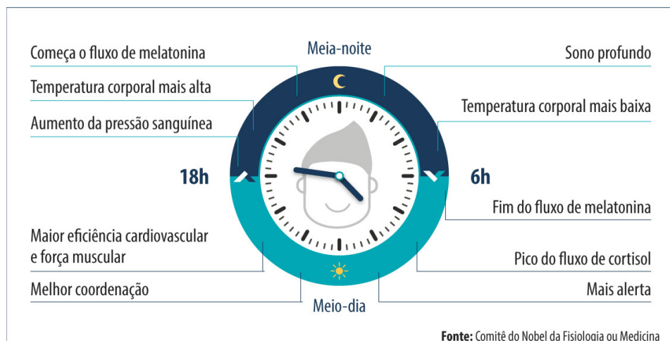
Fig. 2 – Diagrama do Ciclo Circadiano

Um fator importante no sistema visual humano está relacionado com o ciclo circadiano, regulador do sistema biológico e que produz a hormona melatonina - “hormona do sono”. A sua principal função é organizar o ritmo diário de luz e escuridão, bem como as funções corporais dentro de um ciclo de aproximadamente 24 horas.