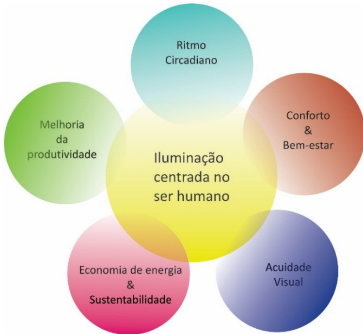
Fig. 3 – Human Centric Lighting (HCL)

Assim, os efeitos visuais e emocionais da luz unem-se aos efeitos não visuais, traduzindo no desenvolvimento de projetos que tem a Iluminação Centrada no Ser Humano ( Human Centric Design – HCL ), que se define numa iluminação que irá atender às necessidades naturais do ciclo de vida humano, proporcionando uma melhoria na qualidade de vida.