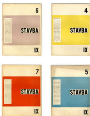
Fig. 3 – Diferentes números de la revista Stavba