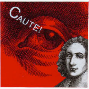
Fig. 7 – Ilustración “¡Cuidado! ¡Spinoza!”

Fuente: Realizada por Manolo Boix para ilustrar textos de Martí Domínguez, extraídas de www.manuelboix.com 2006. Propiedad de La Vanguardia.