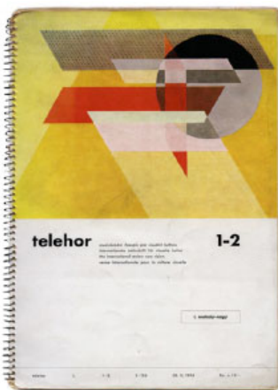
Fig. 5 – Cubierta de la revista Telehor

Fuente: Cubierta de la revista Telehor. László Moholy-Nagy. Extraída de www.deborahkuschner.com 1936. Sin licencia.