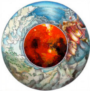
Fig. 6 – Ilustración “¿Un tiempo loco?”

Fuente: Realizada por Manolo Boix para ilustrar textos de Martí Domínguez, extraídas de www.manuelboix.com 2006. Propiedad de La Vanguardia.