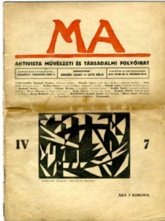
Fig. 1 – Cubierta de la revista MA