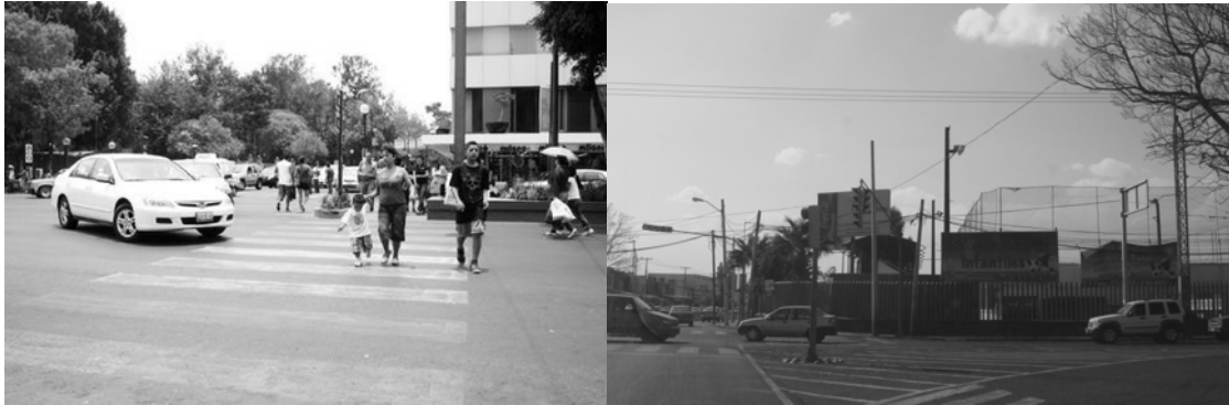
Fig. 6: Problemas de acessibilidade de pedestres.

destres (passarelas para pedestres, semáforos, etc. .) não é suficiente para promover a mobilidade segura (Fig. 6).