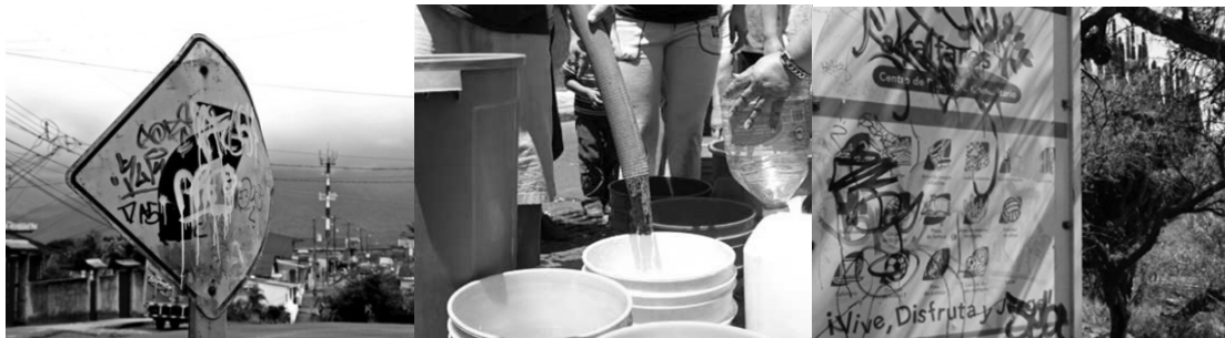
Fig. 7: Negligência da infraestrutura, mobiliário e de mobiliário urbano.

Parte da infraestrutura está intrinsecamente relacionada com as questões socioeconómico e status social, descobrindo que existem partes da cidade onde o planeamento urbano é um tema importante, mas em outras áreas você pode ver o descaso iminente de infraestrutura, móveis e mobiliário urbano (Fig. 7). Portanto, recomenda-se a impulsionar o crescimento da infraestrutural urbana e equipamentos necessários para o desenvolvimento ordenado e sustentável na cidade, promovendo uma melhora no ambiente e os serviços, sistemas de construção e reabilitação de serviços básicos (água, drenagem, energia elétrica, coleta e tratamento de resíduos, entre outros) nas cidades e colônias, aumentando os espaços verdes e de lazer, proteger o patrimônio cultural e histórico, bem como melhorar o comércio, turismo e sector da indústria.