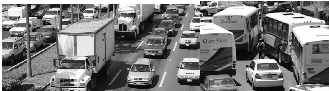
Fig. 5: Problemas de mobilidade dentro da cidade de Santiago de Querétaro.

Na medida em que o transporte público está em causa, é necessário gerar uma reestruturação do sistema, uma vez que, ultimamente, esses sistemas têm crescido fora de controle, prestação de serviço inadequado e inseguro, por isso, os moradores da cidade de Santiago de Querétaro preferem optar para a compra de seu próprio veículo para usar o transporte público.