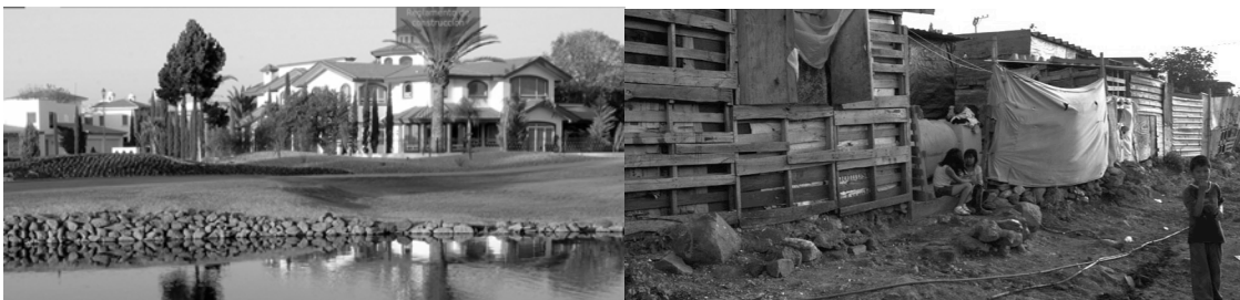
Fig. 4: A desigualdade social dentro da cidade de Santiago de Querétaro.

Santiago de Querétaro é uma cidade de contrastes, mesmo quando os indicadores socioeconómicos mostram uma posição privilegiada no contexto nacional, pode-se observar grandes gengivas Deficit dentro do fator social (Fig. 4).