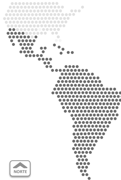
Fig. 1: Região da América Latina e o Caribe

• O Caribe: Antígua e Barbuda, Aruba, Bahamas, Barbados, Cuba, Dominica, Granada, Guadalupe, Haiti, Islãs Caimão, Islãs Turcas e Caicos, Islãs Virgens, Jamaica, Martinica, Porto Rico, República Dominicana, San Bartolomeu, San Cristobal e Neves, San Vicente e as Granadinas, Santa Lúcia e Trinidad e Tobago.