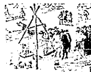
Figura 3. Exemplos de problemas históricos. 2

Pergunto: a quanto deve Joane meter o chumbo no barato para que o barato seja igual e nenhum vá enganado?