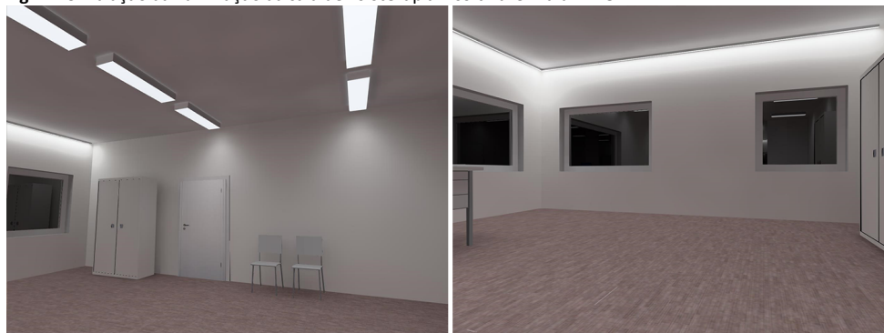
Fig. 7 – Simulação da iluminação da sala de fisioterapia – software Dialux EVO

Próximo às janelas, há downlight com lâmpadas fluorescentes compactas, que se encontram constantemente apagadas. Esta situação deve-se pelo facto que o layout das marquesas leva a que as utentes se deitem com a cabeça no sentido da luminária, tendo uma visão direta da fonte de luz, causando encandeamento. Propõe-se, por isto, a substituição destas luminárias por uma linha de perfil de LED, aplicados no teto, acompanhando o alinhamento das janelas. Desta forma, elimina-se o efeito de encandeamento, proporcionado bem-estar às utentes e um maior nível de iluminação ao terapeuta.