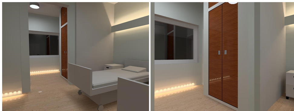
Fig. 5 – Simulação da iluminação proposta para o quarto – software Dialux EVO

No rodapé, será aplicado perfil de LED (4.5W) encastrado no rodapé, com comando por detetor de movimento, que deverá ter um alcance de deteção de pequenos movimentos que consiga cobrir todas as áreas onde o indivíduo possa permanecer, incluindo a zona do chuveiro, com tempo de espera nunca inferior a 10 minutos. O Comando será na entrada da instalação sanitária.