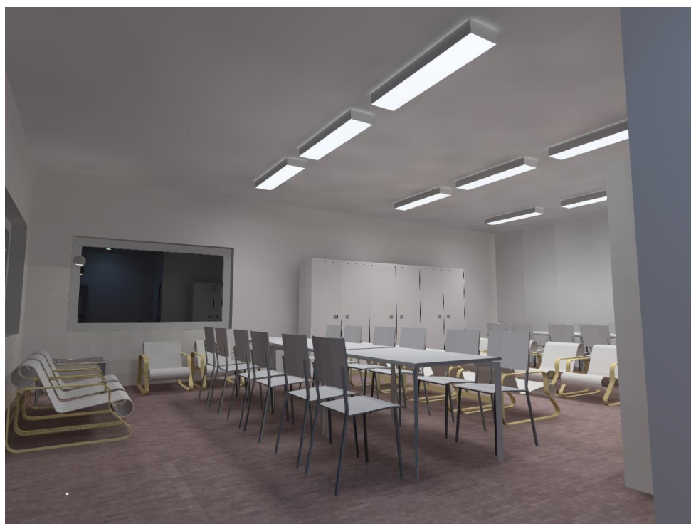
Fig. 9 – Simulação da iluminação da sala de Terapia ocupacional – software Dialux EVO

Um lustre decorativo será aplicado vindo do teto, sobre a mesa de apoio, próximo às janelas, proporcionando iluminação para um conjunto de cadeiras instaladas nas laterais da mesa, proporcionando um nível de iluminação necessário para a confecção de trabalhos manuais. Pelo facto de as janelas estarem localizadas por trás deste conjunto de cadeiras, é preciso manter as persianas fechadas, com o objetivo de controlar a entrada de luz natural no ambiente. O comando será à entrada da sala.