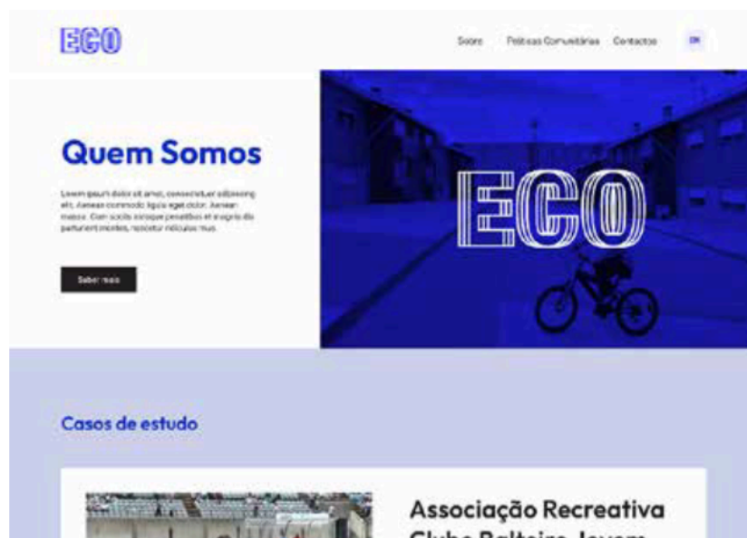
Fig. 1 Interface da página principal.

De seguida, foram realizados esboços simples de baixa fidelidade, possibilitando uma exploração inicial de diferentes conceitos. Inicialmente, procurou-se aplicar um layout de coluna singular. Pretendia-se evitar o posicionamento de elementos lado a lado, para minimizar as dificuldades de leitura na diagonal dos utilizadores com BNL. No entanto, constatou-se que esta abordagem levaria a páginas muito longas, uma solução pouco eficaz,