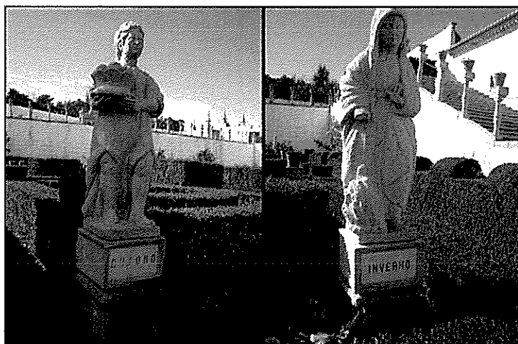
Figuras 3 a 6 - Estátuas representativas das estações do ano