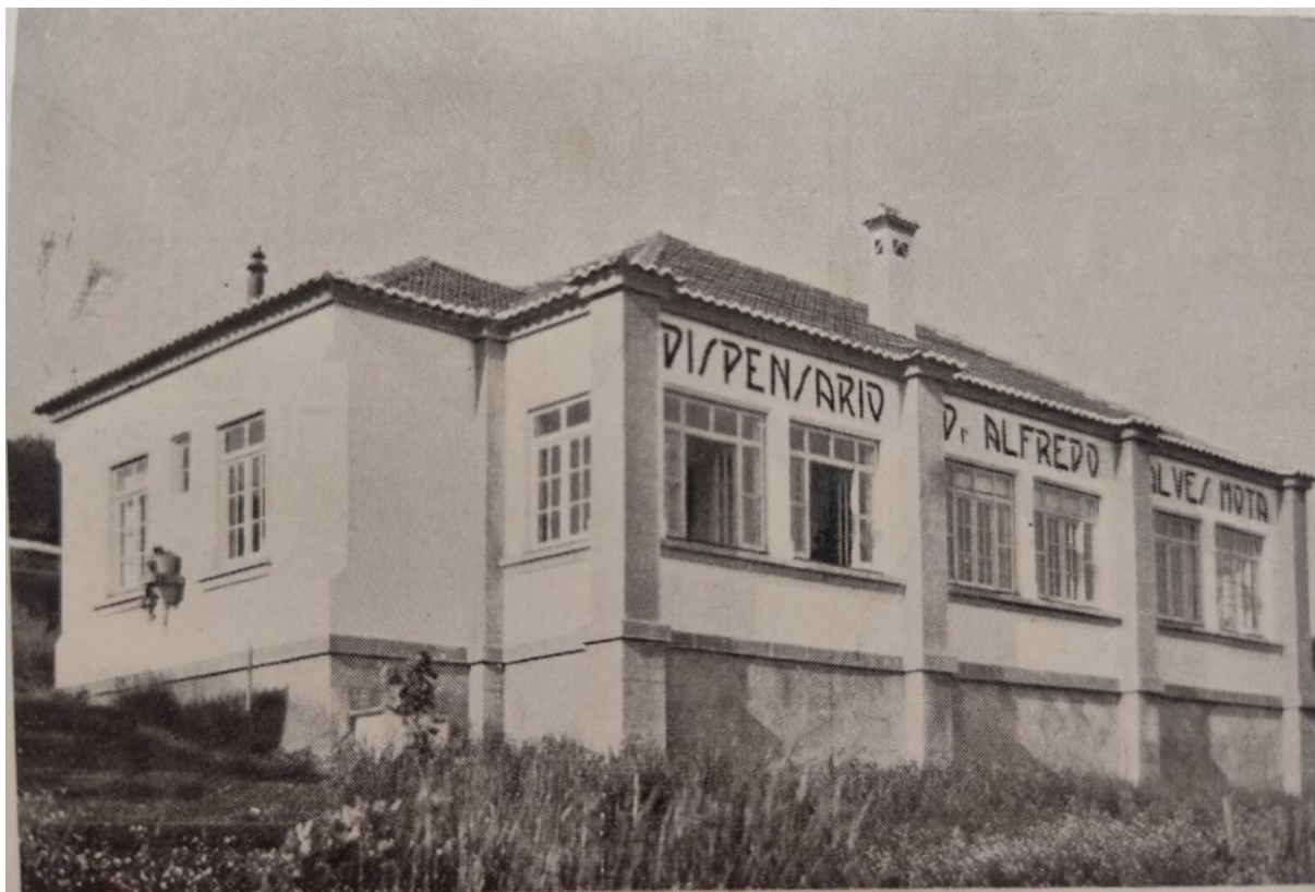
Figura 1 - Pavilhão do Dispensário de Puericultura de Castelo Branco

Nota. De Un service social de puériculture: Monographie (Dias, 1931).