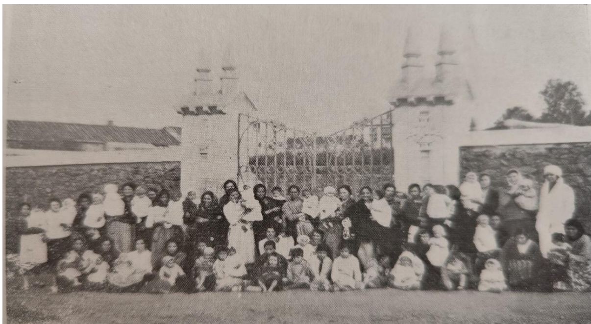
Figura 4 - Distribuição de leite no Dispensário de Puericultura de Castelo Branco

Nota. Mães e filhos aguardam, à entrada da quinta do Dispensário de Puericultura de Castelo Branco, a distribuição de leite de vaca ou artificial destinado à alimentação das crianças. De Un service social de puériculture: Monographie (Dias, 1931).