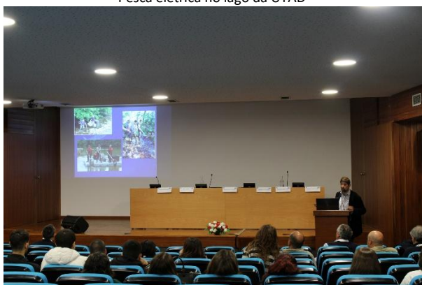
Sessão de palestras - Auditório de Geociências da UTAD