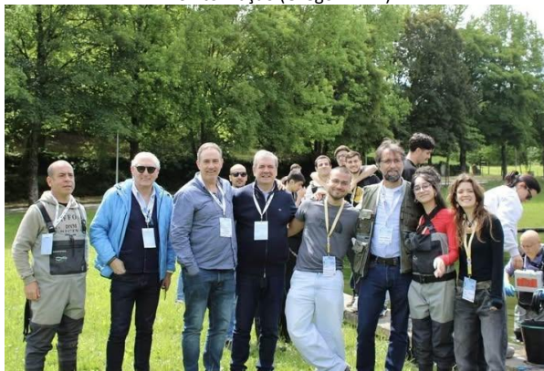
Pesca elétrica no lago da UTAD