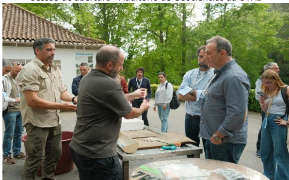
Posto Aquícola do Torno (Marão) - técnicas de marcação de peixes e monitorização (Oregon RFID)