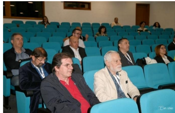
Sessão de palestras - Auditório de Geociências da UTAD