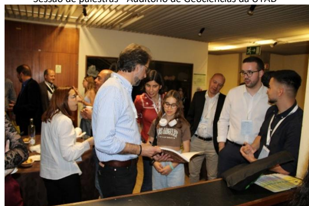
Pausa para café - Auditório de Geociências da UTAD