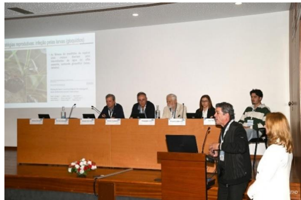
Sessão de palestras - Auditório de Geociências da UTAD