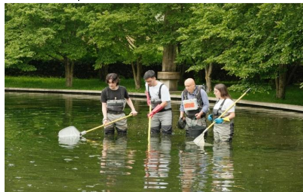
Pesca elétrica no lago da UTAD