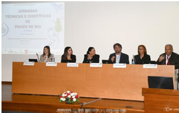
Sessão de abertura - Auditório de Geociências da UTAD