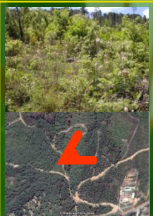
Figura 2: Parcela A (Carvalho). Coordenadas geográficas: 40°07'46.2"N; 7°30'48.8"W; Altitude: 574 m; Histórico de uso: gestão florestal (corte) e fogo.

Nas comunidades de Asphodelus bentho-rainhae são abundantes táxones como Agrostis castellana , Dactylis glomerata subsp. lusitânica , Centaurea aristata e Rumex acetosella subsp. angiocarpus , os quais são característicos da Agrostion castellanae e unidades superiores, sendo também frequentes espécies como Pteridium aquilinum , Arrhenatherum bulbosum , Hypochaeris radicata , Lithodora prostrata , Genista falcata e Cytisus multiflorus , táxones característicos de algumas das etapas seriais do bosque climatófilo.