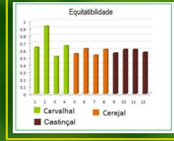
Figura 5: Gráficos de diversidade (riqueza específica, Índice de Shannon e equitabilidade) para as parcelas de carvalho, castiçal e cerejal na serra da Gardunha.