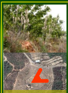
Figura 4: Parcela C (Cerejal). Coordenadas geográficas: 40°07'28.6"N; 7°31'11.1"W; Altitude: 721 m; Histórico de uso: cerejal em modo biológico sem uso de herbicidas.