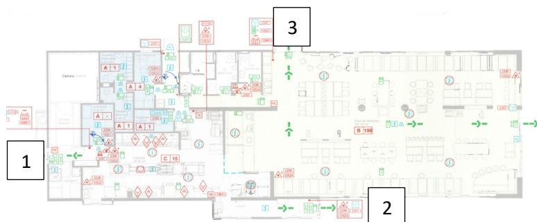
Figura 1. Localização do foco de incêndio e das saídas utilizadas pelos ocupantes

Para calcular o tempo de percurso considera-se três situações distintas de distâncias a serem percorridas até que o último ocupante abandone completamente o edifício. A primeira situação