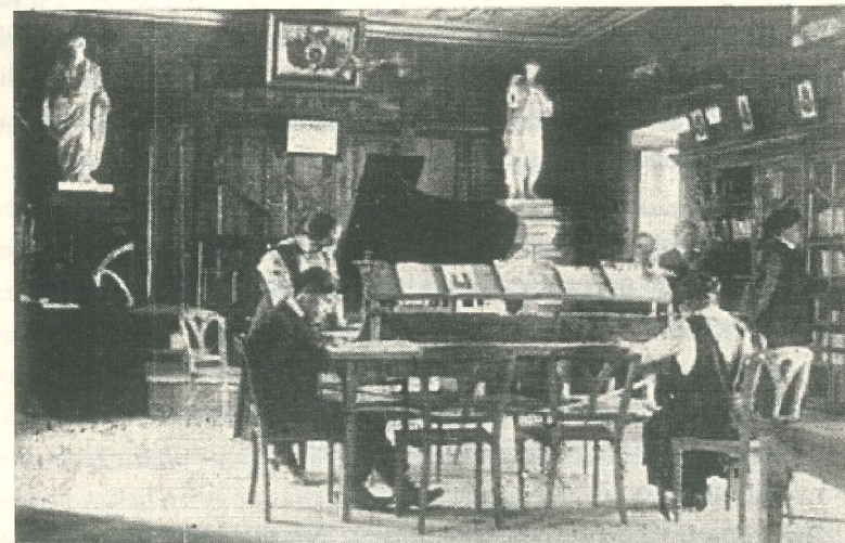
Figura 3: Biblioteca e sala de leitura na Escola Normal de Sucre, em 1917

paços da Escola Normal, das salas de aula e laboratórios e dinamiza a Biblioteca da Escola Normal com material didático (Figura 3), obras pedagógicas e enciclopédias, já iniciada e instalada por Rouma, desde 1910 (exigindo do Governo recursos indispensáveis); cria o gabinete de informações pedagógicas (espécie de orientação escolar); desenvolve, pela primeira vez, nas escolas o papel dos médicos (higiene escolar/social) e das enfermeiras (assistência); organiza e publica a obra o Syllabus do Curso de Direcção e Organização das Escolas e Metodologia das Ciências Naturais; promove a coeducação nas escolas, a qual será proibida em 1922; etc. Ou seja, na esteira de G. Roma realiza a renovação educativa na Bolívia, sendo apoiado por aquele amigo belga e pelo Governo na época.