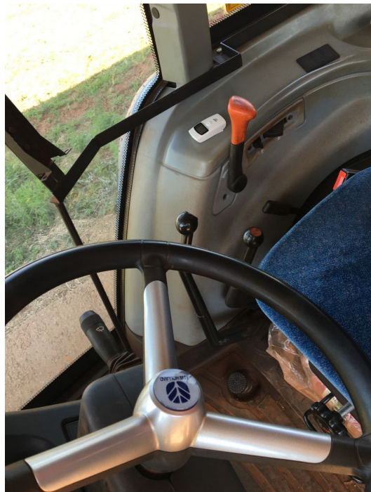
Fig. 4 – Registrador de temperatura fixado próximo ao corpo do operador.

Para o delineamento dos dados, utilizou-se um fatorial incompleto 5X4, onde os dados obtidos nos ensaios foram submetidos a uma análise de variância sendo complementada pelo teste de Tukey, considerando significativo quando p < 0,05 , para a variável ruído.