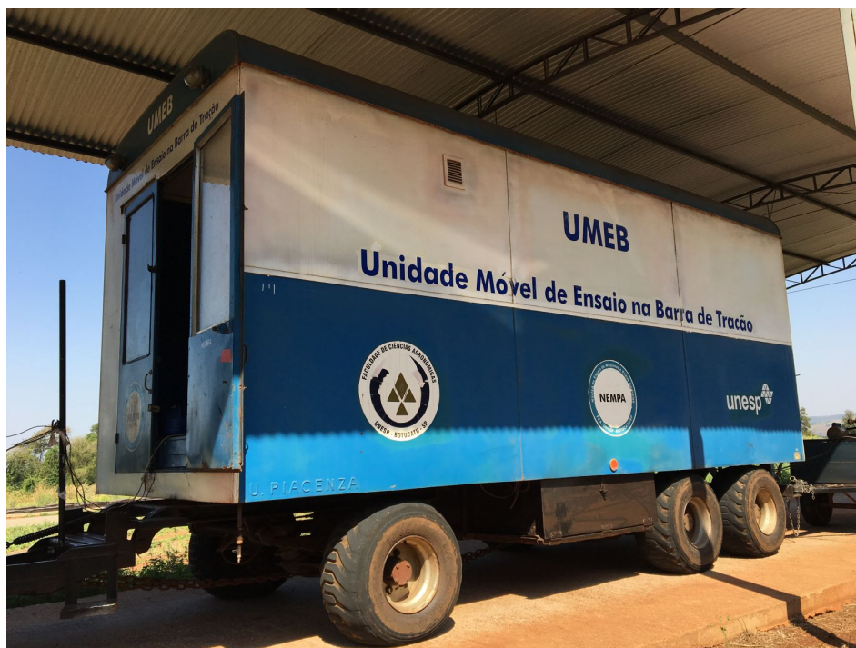
Fig. 1 – Unidade Móvel de Ensaio da Barra de Tração – UMEB.

Para o ensaio “dinâmico”, a medição do ruído dentro da cabine apresentado no trator durante os ensaios foram feitas na altura do ouvido do operador (Figura 2) de acordo com a NR 15, na direção da fonte sonora de maior intensidade, onde foram coletadas quatro amostras de cada combinação de marcha com a potência em um intervalo de 15 em 15 segundos.