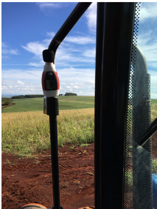
Fig. 3 – Decibelímetro fixado na parte externa do trator para coleta de dados.

Para o ensaio em “rotação de trabalho” foi acoplado uma grade intermediária e para a medição de ruído repetiu-se a mesma metodologia utilizada no ensaio “dinâmico”. Foram usadas três condições para coleta de ruído nas máquinas agrícolas com as seguintes variáveis: