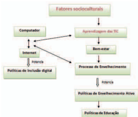
Figura 2: Modelo de Análise

De acordo com os objetivos apresentados, fizeram ainda parte da amostra 5 Diretores das universidades seniores aos quais foram realizadas entrevistas semiestruturadas com o objetivo de recolher as opiniões destes no que diz respeito aos fatores sociais e culturais envolvidos na aprendizagem das TIC por parte dos participantes. Nas entrevistas realizadas pretendeu-se perceber qual o potencial impacto no «Bem-estar mental» e no «Bem-estar social» desta aprendizagem ao longo do processo de envelhecimento e conhecer as políticas sociais sugeridas pela direção destas universidades para melhorar a