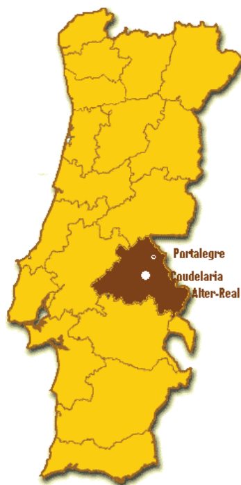
Figura 1 – Localização da Coudelaria de Alter

A Tapada do Arneiro situada no termo da vila de Alter do Chão, no Alto Alentejo, era pertença da Casa Ducal de Bragança desde 1461, o que, de algum modo, veio contribuir, juntamente com a qualidade da água e dos pastos, para a instalação nesse local da Coudelaria Real.