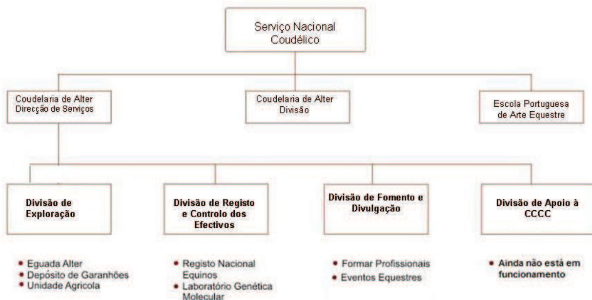
Figura 2 – Organograma do Serviço Nacional Coudélico

Como se pode ver através da Figura 2, a Coudelaria de Alter encontra-se sob a dependência do Serviço Nacional Coudélico apresentando a seguinte estrutura (Decreto-Lei n.º 97/97).