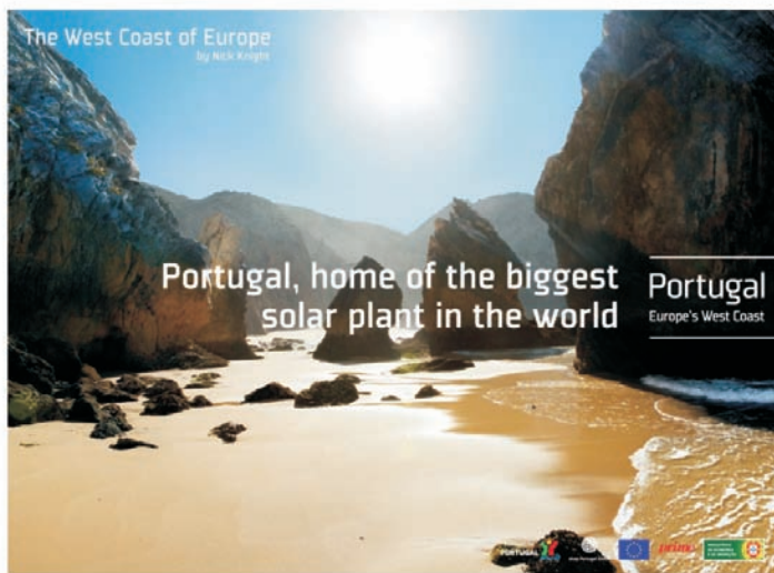
Figura 8: Material Promocional da Marca Portugal (“Portugal com a maior central foto voltaica do mundo”, www.min-economia.pt )

Os resultados deste programa estão ainda a ser avaliados. Com efeito, assistimos nos últimos meses à concretização do eixo quatro, tendo decorrido uma forte campanha promocional procurando reposicionar o país. O dia 13 de Dezembro de 2007 marcou o arranque da campanha, aproveitando o momento mediático da assinatura do Tratado de Lisboa pelos Chefes de Estado e de Governo dos 27 países-membros da União Europeia. “Portugal Europe’s West Coast” foi a assinatura dessa campanha de promoção que pretendeu alterar a percepção externa de Portugal, associando o país ao Oeste da Europa e a conceitos de modernidade, inovação, tecnologia (figura 8), empreendedorismo e qualidade de vida. De acordo com os dirigentes do país, pretendeu-se utilizar a campanha como alavanca na captação de investimentos e atracção de talentos, visando tornar o país mais competitivo, consolidando ao mesmo tempo a sua imagem de grande destino turístico e o seu cariz cultural.