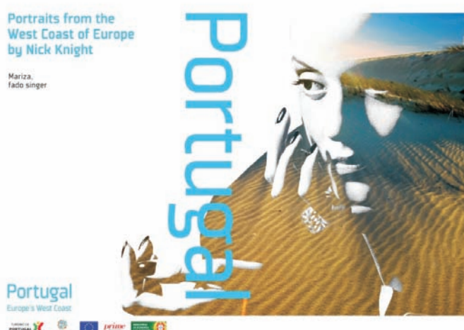
Figura 9: Material Promocional da Marca Portugal ( www.min-economia.pt )

A campanha foi promovida nos mercados nacional e internacional - Alemanha, Espanha, França e Reino Unido -, em publicações de grande prestígio, tais como The Economist , Condé Nast Traveller , Time , Newsweek , Vogue , Stern , Le Monde , Le Figaro Magazine , El País e El Mundo .