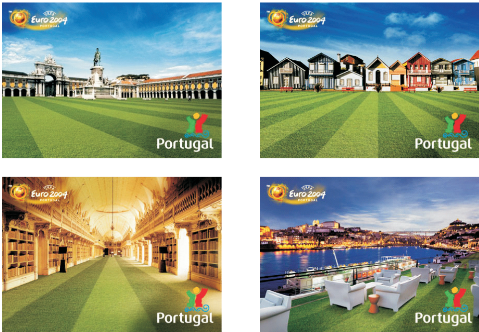
Figura 7: Postais do Euro 2004 (ICEP)