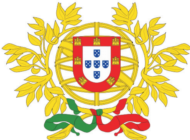
Figura 2: Brasão de Armas de Portugal ( www.pt.wikipedia.org )

O logótipo de Portugal (figura 3), concebido pelo artista plástico português José de Guimarães, em 1992, para o Instituto das Empresas para os Mercados Externos (ICEP), no âmbito da criação de uma identidade gráfica e conceptual para a promoção da oferta de Portugal no sector do turismo.