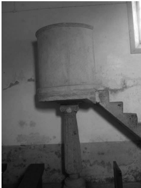
Fig. 2 - Púlpito