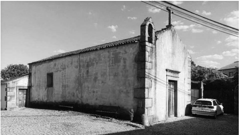
Fig. 1 - Capela de Nossa Senhora das Neves em Escalos de Baixo.

A capela de Nossa Senhora das Neves é por tradição o templo mais antigo de Escalos de Baixo, devendo ser a sua génese provável do século XVI, aquando da separação da paróquia vizinha de Escalos de Cima. Hoje o seu aspeto em nada reflete essa era. Tem aparência simples no exterior e com alguns pormenores dum avançado século XVIII. O interior possui um altar-mor de boa qualidade, um púlpito com uma das inscrições que irei apresentar, para além de outros elementos soltos que a seu tempo serão publicitados. Queria também chamar a atenção para o avançado estado de