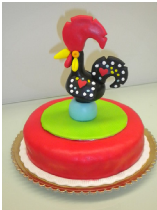
Figura n.º 10: Chocolates: versão embalagem Galo de Barcelos