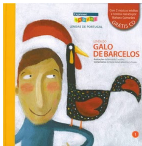
Figura n.º 1: Livros alusivos ao Galo de Barcelos

Fonte: http://portfoliogruponalusa.blogspot.com