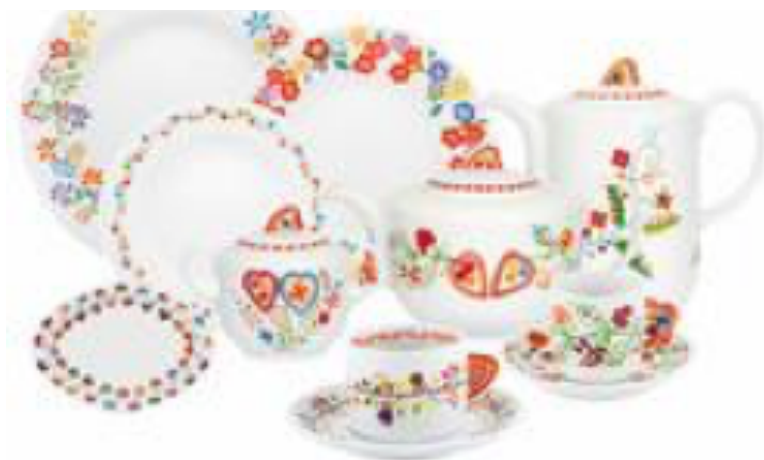
Figura n.º 8: Utilização dos Lenços de Viana em loiça – versão serviço de jantar