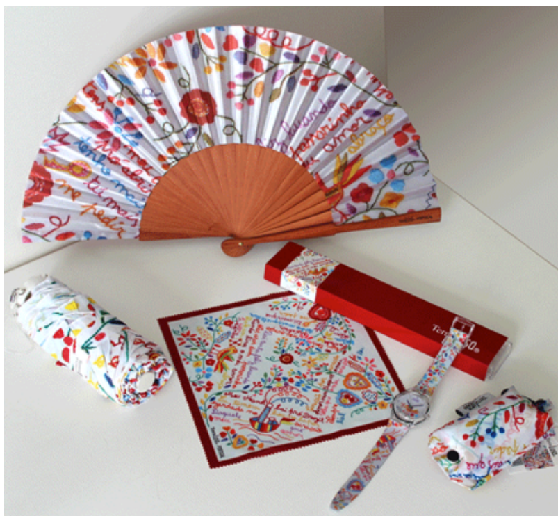
Figura n.º 9: Linha de Merchandising relativa aos Lenços de Viana